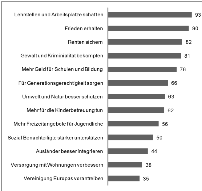
Abbildung: Wichtigkeit von Politikzielen bei 16- bis 29-Jährigen in Deutschland (in Prozent)*